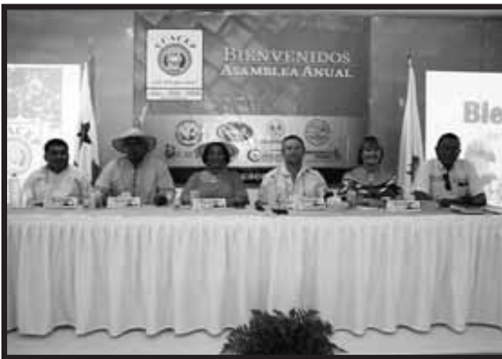
Asamblea de UCACEP