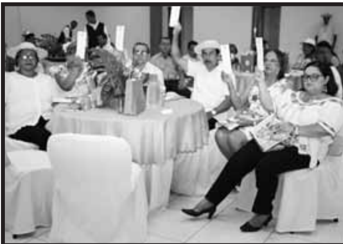
Votación en Asamblea de UCACEP