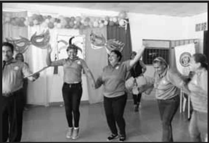
Convivio Deportivo en Coclé