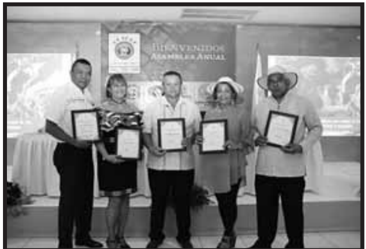
Reconocimiento a Directivos de UCACEP