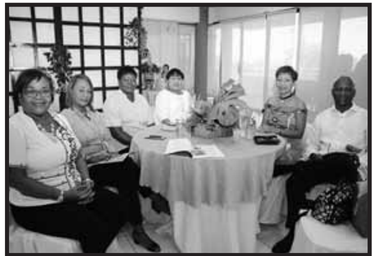
Asamblea de UCACEP