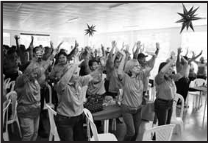
Convivio Deportivo en Coclé