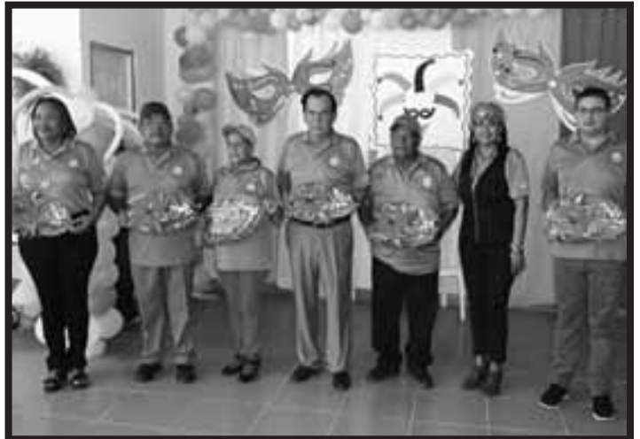
Convivio Deportivo en Coclé