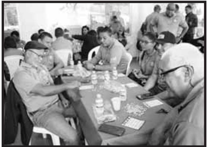
Convivio Deportivo en Coclé